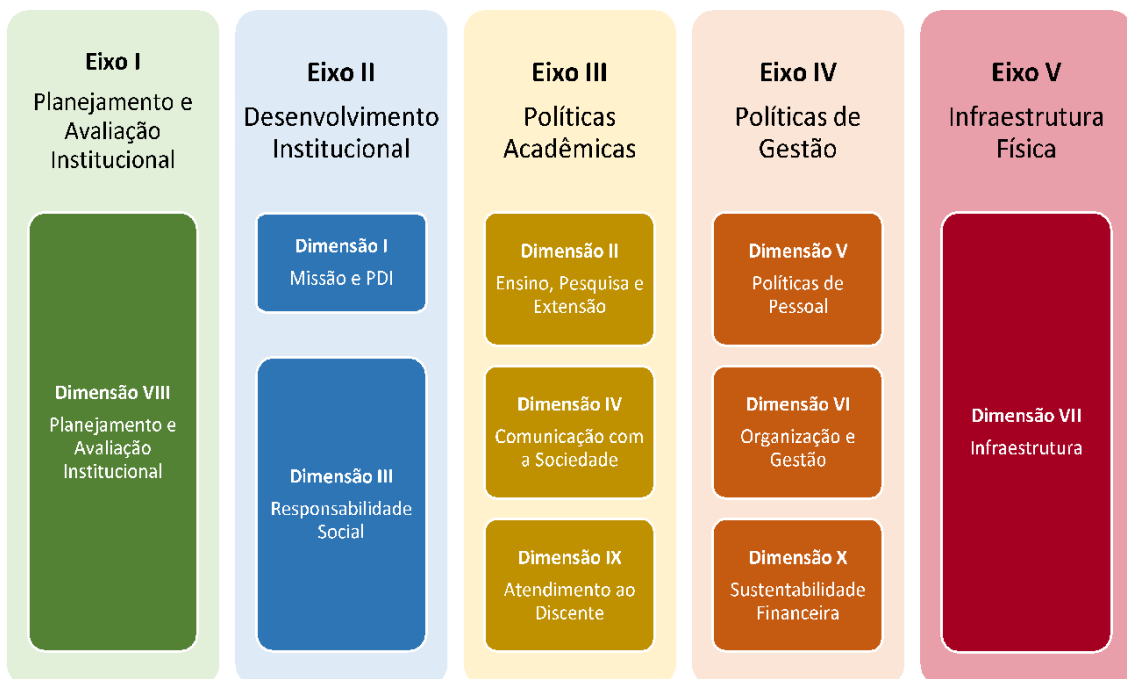
Figura 2 – Eixos e dimensões do SINAES

Essa autoavaliação, realizada em todos os cursos da IES, a cada semestre, de forma quantitativa e qualitativa, atenderá à Lei do Sistema Nacional de Avaliação da Educação Superior (SINAES), nº 10.8601, de 14 de abril de 2004. A legislação irá prever a avaliação de dez dimensões, agrupadas em 5 eixos, conforme ilustra a figura a seguir.