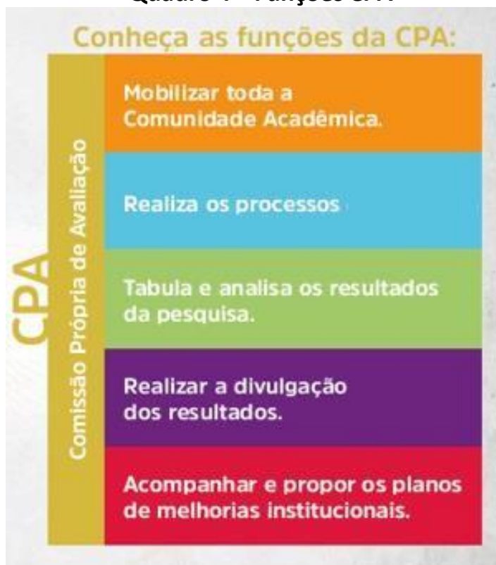
Quadro 4 – Funções CPA